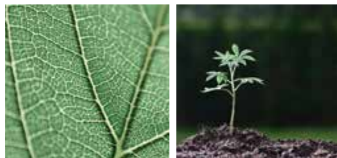
Met klimaatneutrale reiniging tillen we Kärcher ecoefficiency naar een hoger plan.